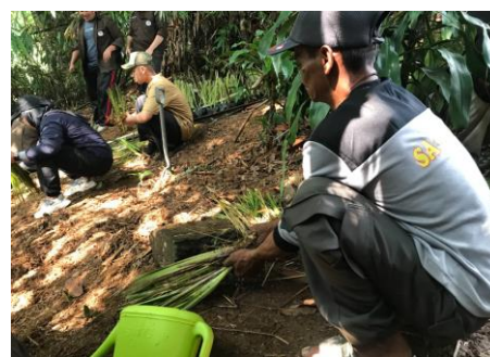
Gambar 4. Penanaman rumput vetiver