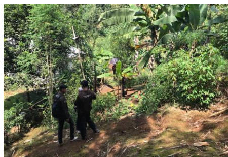
Gambar 1. Pengukuran kemiringan lereng RW 04 titik 3