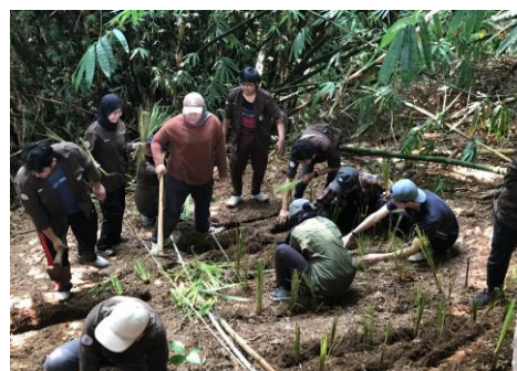
Gambar 3. Persiapan lahan sebelum penanaman

Kedua titik lokasi ini dipilih karena berdekatan dengan pemukiman warga dan keadaan lokasi yang lebih memadai sehingga menjadi prioritas penanaman vetiver efektif. Penanaman rumput vetiver di kedua titik dilakukan pada seluruh lahan sesuai dengan ketentuan Kementerian PUPR Tahun 2012 mengenai Pedoman Penanaman Rumput Vetiver untuk Pengendalian Erosi Permukaan dan Pencegahan Longsor Dangkal pada Lereng Jalan [10]. Sebelum penanaman dilakukan, lahan terlebih dahulu dibersihkan dan digemburkan seperti yang terlihat pada Gambar 3. Bibit rumput vetiver ditanam pada lahan yang sudah dibersihkan dan digemburkan. Rumput vetiver ditanam dengan jarak antar tanaman \pm 10 \text{ cm} dan jarak antar baris \pm 40 \text{ cm} . Adapun kegiatan penanaman ditampilkan pada Gambar 4.