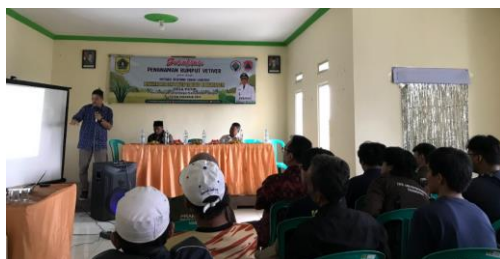
Gambar 2. Penyampaian sosialisasi bencana longsor dan upaya mitigasi

Materi disampaikan oleh perwakilan BPBD, yang menekankan peran aktif masyarakat dalam mitigasi bencana longsor, dan dosen Departemen Teknik Sipil dan Lingkungan IPB University, yang menjelaskan bencana longsor, zona kerentanan di Desa Petir, serta penerapan bioengineering dengan vetiver. Kegiatan ini memperkenalkan masyarakat pada metode bioengineering dengan tanaman vetiver. Pengenalan penggunaan vetiver mencakup penjelasan mengenai sistem perakaran yang menembus tanah 3–5 meter, tingkat keberhasilan tumbuh 87%, manfaat ekologis dalam menahan erosi dan memperkuat lereng, serta standar teknis penanaman sesuai pedoman PUPR [8]. Pelaksanaan kegiatan dapat dilihat pada Gambar 2.